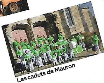
Les cadets de Mauron