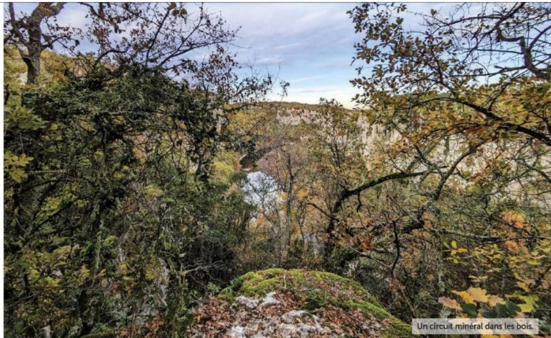
Un circuit minéral dans les bois.