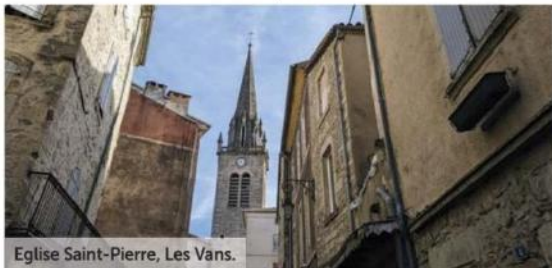
Eglise Saint-Pierre, Les Vans.

Naves. A quelques kilomètres des Vans, le village perché de Naves est un joyau d'architecture typique du Sud-Ardèche, très bien conservé. Les vestiges du château, la porte à herse, les fenêtres à meneaux, l'église romane du XII e siècle et la beauté générale du village sont à voir.