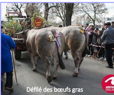
Défilé des bœufs gras

Après midi : défilé des bœufs gras avec Lous Dé Bazats (groupe folklorique).