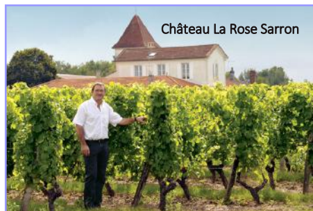
Château La Rose Sarron