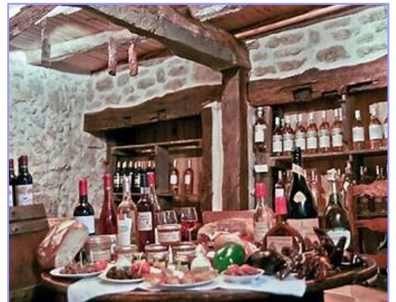
La ferme de Lafitte à Montgaillard

Apéritif et saucisson Garbure au jarret Salade du terroir Jambon braisé et ses légumes Salade et fromage du pays Croustade aux pommes et à l'armagnac Café, vin rouge et rosé