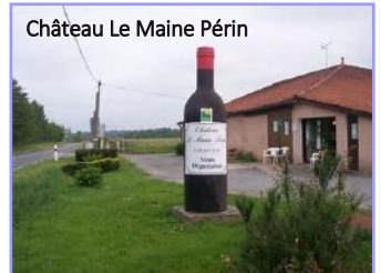
Château Le Maine Périn

Terrine de Mamé et pizza Pavé de bœuf Bazadais et gratin dauphinois Tomme de Bazas et salade Dessert de Captieux Vin compris