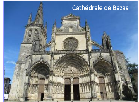
Cathédrale de Bazas

Après midi : défilé des bœufs gras et concours, visite de la cathédrale et sous la halle marché de producteurs. 17h00 : retour au Maine Périn.