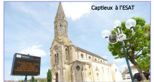
Captieux à l'ESAT

Après midi : défilé des bœufs gras avec Lous Dé Bazats (groupe folklorique).