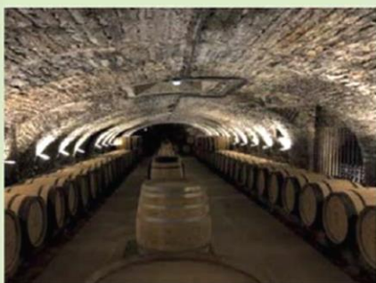
Les vins de l'année sont mis en fût.

Plein tarif : 12 €. Tarifs réduits : 8 € pour les étudiants de - de 26 ans, 4 € pour les enfants de 10 à 17 ans. Des billets thématiques sont disponibles, par ailleurs. Tarif spécial groupe.