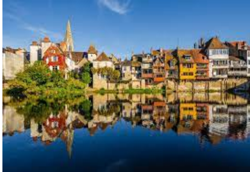
La Venise du Berry à Argenton-sur-Creuse