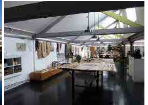
La chemiserie à Argenton-sur-Creuse