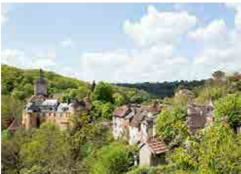
Château de la Villa Algira à Gargilesse