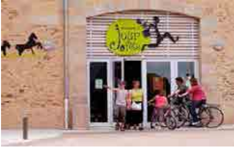
Sainte Sève Maison du jour de fête