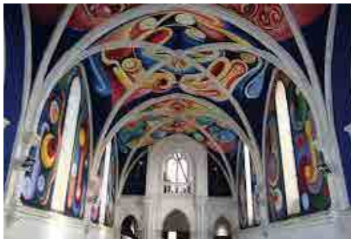
L'église de Menoux