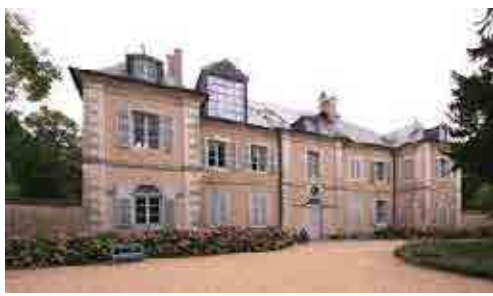
Domaine de George Sand à Nohant