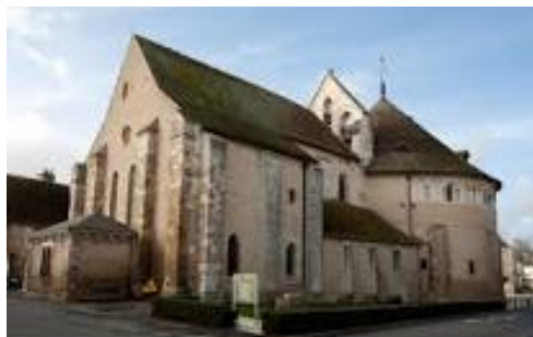
Basilique romane de Neuvy Saint Sépulchre