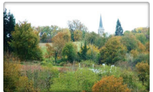
Maison des traditions à Chassignolles