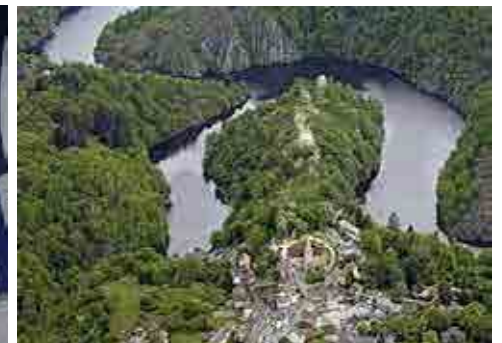
Ruines du Crezant