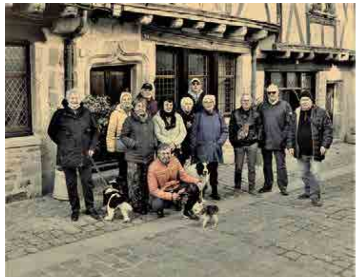
Photos : La Mottebeuvron, Pays Cathare, Ile d'Oléron, La Roumanie , St Valentin en Vendée...