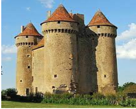
Château de Sarzay