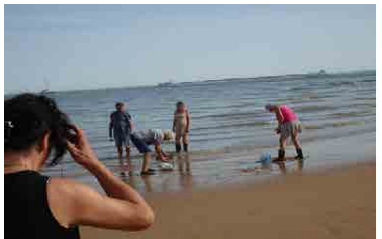
Photos : L'île d'Oléron