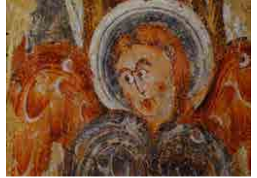
Église Saint Martin Fresques romanes