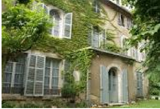
Domaine du Petit Coudray