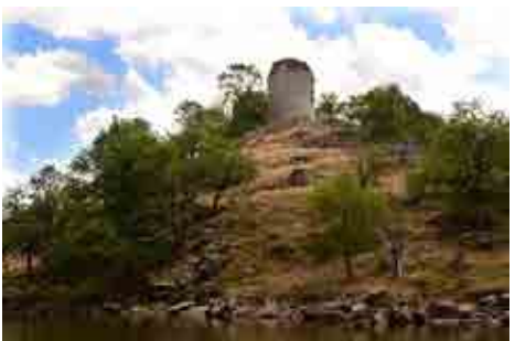
Balade en vedette autour des payages