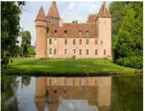
Château de la Motte Feuilly