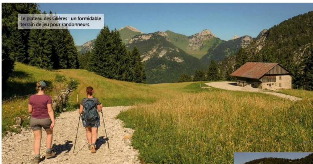
Le plateau des Glières : un formidable terrain de jeu pour randonneurs.