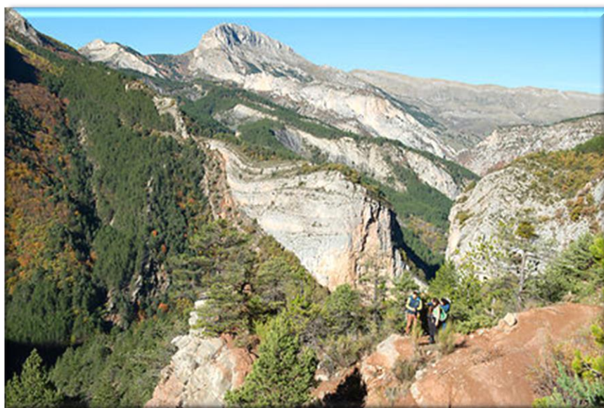
Randonnée vieil Esclangon

Soudain, la clue du Péroure surgit au-dessus de la forêt de chênes et de pins en attendant la vue époustouflante au col de l'Esclanchière... Un panorama imprenable sur le Vélodrome à 1 151 m d'altitude nous attend. Au sol, des pierres fossilisées remplies de cailloux sédimentaires évoquent la présence d'une plage vieille de plusieurs millions d'années.